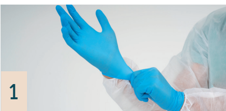
1 Handschuhe zum Einmalgebrauch, 100 Stück

Schützen pflegebedürftige Personen während der bedenkenlosen Durchführung der Pflegetätigkeiten.