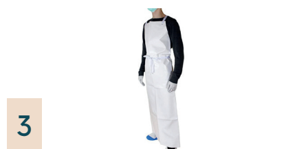
3 Wiederverwendbare Schutzhürze, 1 Stück

Schützt die Kleidung bei pflegerischen Tätigkeiten. Mit Verschlussbändern an der Taille für guten Sitz.