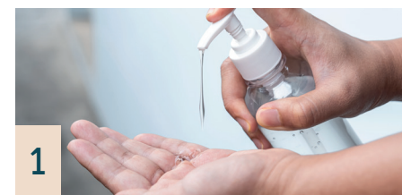
1 Händedesinfektion*, 500 ml

Nehmen Flüssigkeiten zuverlässig auf. Die Haut bleibt trocken und die Matratze wird geschützt.