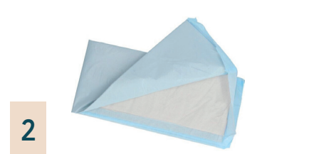
2 Bettschutzeinlagen zum Einmalgebrauch, 25 Stück

Dient zum Schutz der Kleidung vor Schmutz, Flüssigkeiten und ist abwischbar. Größe: 140 x 90cm