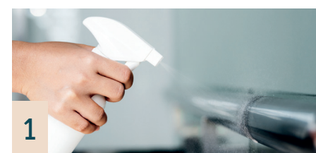
1 Flächendesinfektion*, 500 ml

Mindert das Infektionsrisiko und reduziert Keime. Viruzid, wirksam gegen MRSA- und Noroviren.