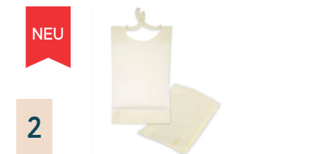
2 Schutzservietten zum Einmalgebrauch, 100 Stück

Materialschonende Desinfektion und Reinigung von medizinischem Inventar sowie Flächen aller Art.