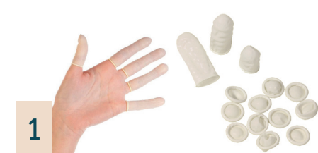
1 Fingerlinge, 100 Stück

Mit Auffangtasche. Die PE-Innenbeschichtung verhindert das Durchdringen von Nässe.