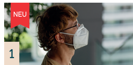
1 FFP-2 Mundschutz ( einzeln verpackt, 10 Stück )

Mehrlagige Abdeckungen verhindern Tröpfcheninfektionen und reduzieren so die Keimausbreitung deutlich.