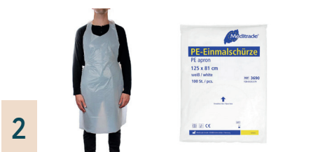
2 Schutzhürzen zum Einmalgebrauch, 100 Stück

Gebrauchsfertige, mit alkoholischer Wirkstofflösung getränkte Tücher zur Reinigung von Oberflächen.